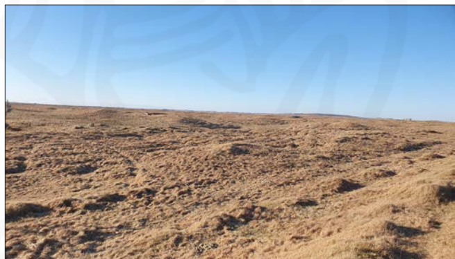
Leið RA-439:027, horft til suðvesturs. Göturnar sjást lítið innan deiliskráningarreitsins.

"Nyrst í Markhelluheiði á götunum að ærhúsum Norðurbæjar [026 og 059] er dálítill steinn sem nefnist Grásteinn ..." segir í örnefnalýsingu. Þessi leið er sýnd á Herforingjaraðskorti frá 1908 og lá hún frá Hvammi að beitarhúsum 026 og 059 og áfram til vesturs, á leið 681:025 sem liggur upp með Þjórsá að ferju 010 á Hrosshyl. Um 500 m vestan við bæ 001 liggur leiðin skáhallt yfir deiliskipulagsreit þar sem fyrirhugað er að reisa vinnubúðir tengdar Hvammsvirkjun.