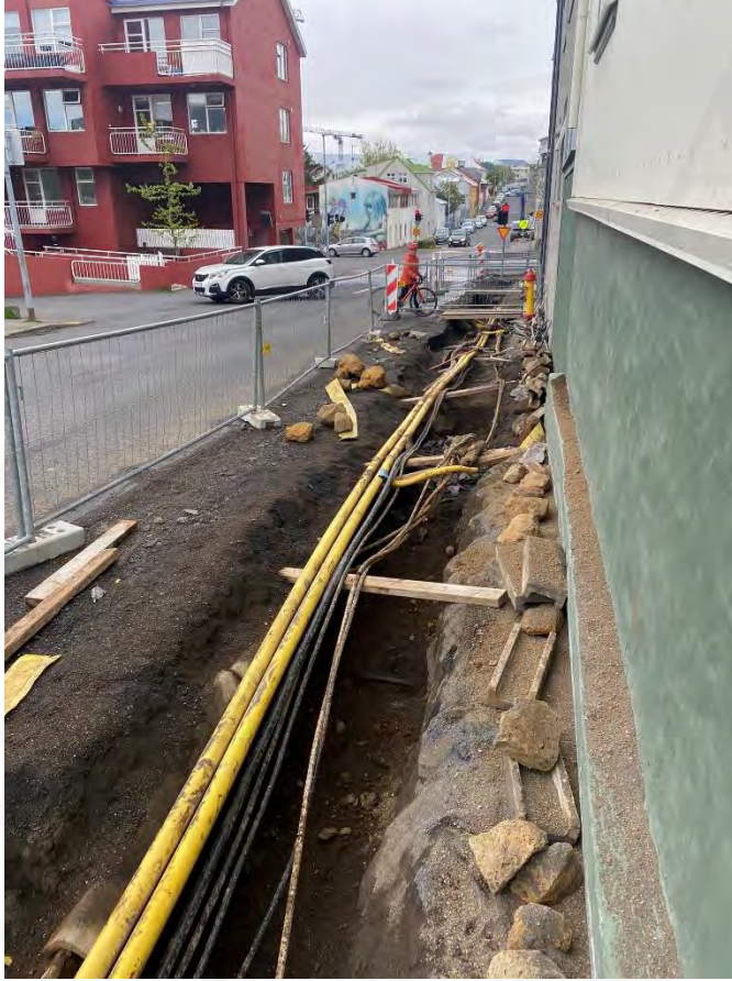
sniðum þeirra skurða sem grafnir voru. Það er Mynd 2. Skurður sunnan Framnesvegjar, framan við Framnesveg 59. Horft í norðvestur.