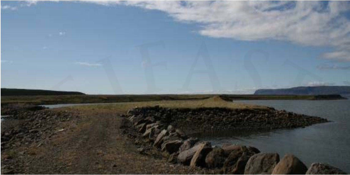
Mynd 5. Orrustuhólmi í Saurbæ