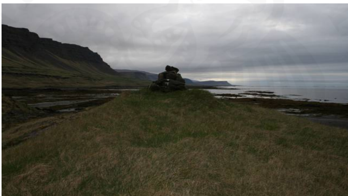
Mynd 4. Klapparhóll og ásetuþúfa með vörðubroti á Píngeyri í landi Tjaldaness.