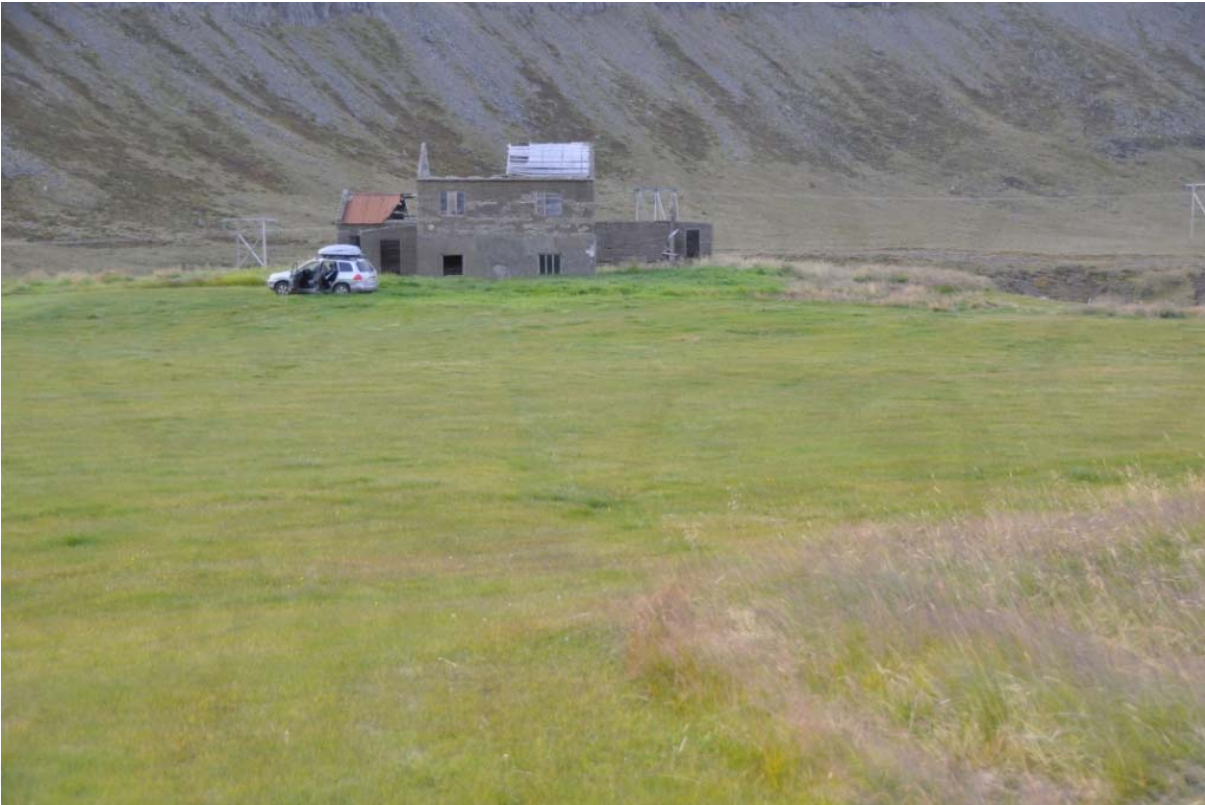
Mynd 7. Frá Belgsdal. Myndin er tekin í suðurjaðri túnsins og sjá má dæld fyrir miðri mynd, sem gæti mögulega verið þar sem vatnsleiðslan liggur.