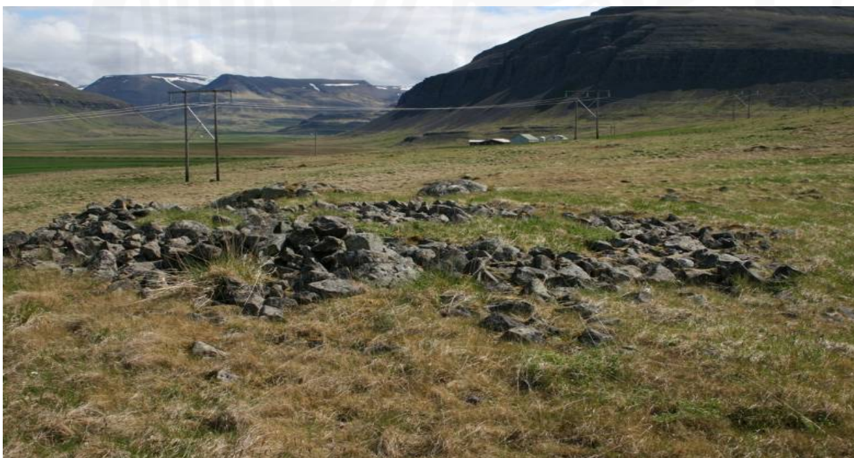
Mynd 6. Náttúruleg grjótdys í landi Stóra-Múla í Saurbæ.

Grjótdys er í gróinni brekku ofan vegar, um 200 í SV frá Stóra-Múlubæ. Talin geta verið legstaður, en líkist náttúrulegri dys.