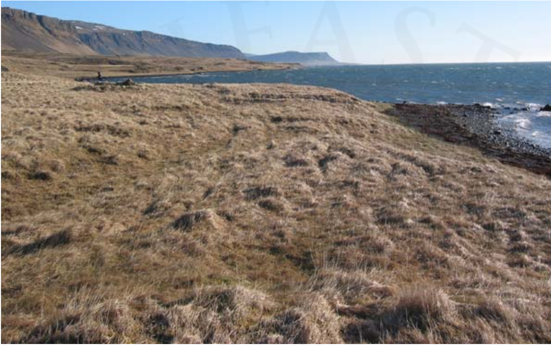
Mynd 3. Kumlateigur á Fagradalseyri.