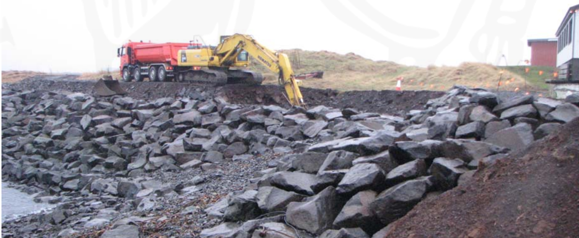
Mynd 4 Upphaf vélgraftar við bæjarhólinn.

Hóllinn stendur við vesturenda Kalmansvíkur. Farið er eftir Ægisbraut í norðvestur, út á enda og gengið í ASA, um 300 m. Grasi vaxinn hóll sem stendur í útjaðri byggðar og út á sjávarbakkannum. Rof er í bakkann. Allur vesturhluti túnsins, þ.e. túnið vestan og sunnan Presthúsabæjar, er horfinn undir nýbyggingar. Austurendi túnsins nær út að sjó yst í Kalmansvík og er það enn autt svæði. Göngustígur er þvert yfir hóllinn og lítilsháttar rof þar í. 4