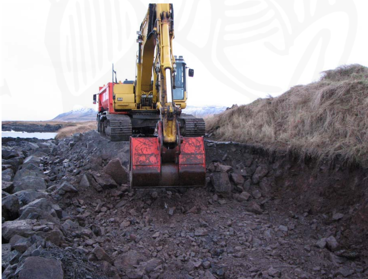
Mynd 5 Hér sést þegar verið var að fjarlægja malarstíginn.

Fyrirnefndur varnargarður og malarstígur voru gerðir nýlega þ.e. eftir 1998 þegar fornleifaskráning fór fram og hefur garðurinn varnað því að meira hafi brotnað af bæjarhólnum. Malarstígurinn reyndist nægilega breiður fyrir lagnaskurðinn og því þurfti ekki að hrófla við fornleifunum sjálfum við framkvæmdina nú.