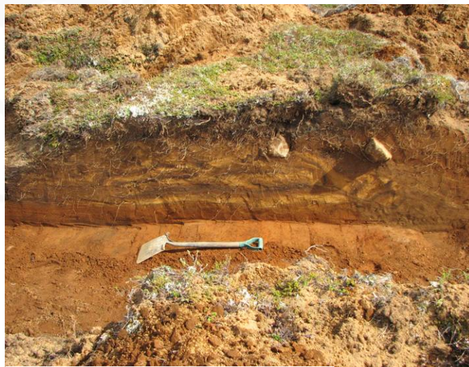
Mynd 3: Norðaustursnið garðlagsins