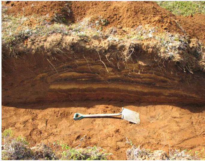
Mynd 2: Suðvestursnið garðlagsins

Að höfðu samráði við minjavörð var ákveðið að vélgrafa könnunarskurð í garðlagið þar sem pípan kemur til með að liggja í gegnum það, með það fyrir augum að greina aldur þess og byggingarlag. Voru norðaustur og suðvestursnið skurðarins skráð með hefðbundnum aðferðum, þ.e teiknuð og ljósmynduð, auk þess sem teknar voru ljósmyndir af garðlaginu eins og það lítur út á yfirborði.