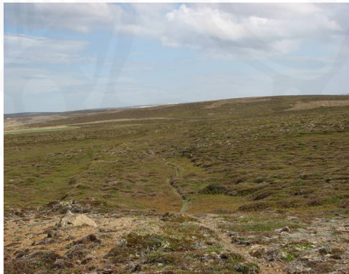
Mynd 1. Horft norðaustur eftir garðlaginu

Fyrirhugað er að byggja raforkuvirkjun í ánni Köldukvísl í landi Eyvíkur á Tjörnesi. Stöðvarhús virkjunarinnar kemur til með að vera vestan megin við mót Köldukvíslar og Tunguár, um 300 m fyrir neðan þjóðveginn sem liggur um Tjörnes, en virkjunin sjálf verður um 3 km ofar í ánni. Aðrennslispípa frá virkjuninni í stöðvarhúsið og vegur sem liggja á meðfram henni koma til með að þvera fornt garðlag sem liggur norðaustur-suðvestur gegnum land Eyvíkur, um 1 km sunnan við veginn. Eftir að hafa litið á aðstæður þann 7. nóvember 2006, komst minjavörður Norðurlands Eystra, Sigurður Bergsteinsson, að þeirri niðurstöðu að rannsaka þyrfti garðlagið á þeim kafla sem kemur til með að raskast vegna aðrennslispípunnar og vegarins, áður en framkvæmdir gætu hafist. 1 Þann 31. maí 2007 hafði Einar Jóhannesson, forsvarsmaður eignarhaldsfélagsins Köldukvíslar sem stendur fyrir byggingu virkjunarinnar, samband við Fornleifastofnun Íslands og fór fram á að hún tæki að sér rannsóknina og fór hún fram tveim dögum seinna eða 2. júní. Rannsókn á vettvangi var unnin af Howell M. Roberts og Oddgeiri Hanssyni, en sá síðarnefndi sá jafnframt um úrvinnslu gagna.