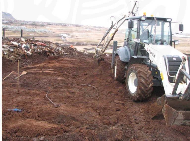
Mynd 5: Unnið að vélgræftri á Svæði C. SK12 er vinstra megin á myndinni Horft til vestsuðvesturs

Eftir að hafa litið á aðstæður í SK12 komst fulltrúi Fornleifaverndar ríkisins að þeirri niðurstöðu að óhætt væri að notast við skurðgröfu við að fletta yfirborðslögum af þeim hluta vegstæðisins sem liggur yfir bæjarhólinn. Áður en