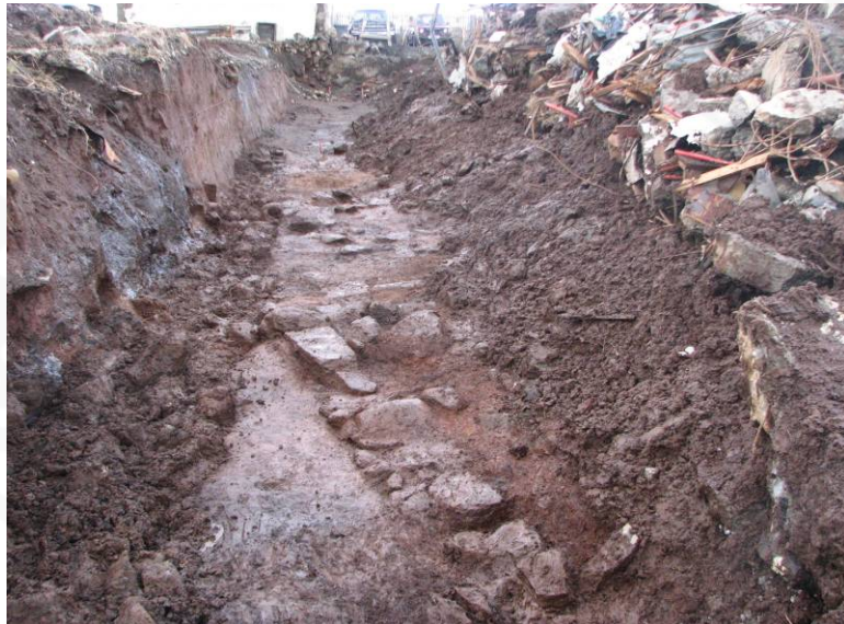
Mynd 3: SK12 að lokinni hreinsun. Vegghleðslurnar í vesturenda skurðarins eru í forgrunni fyrir miðri mynd

austnorðausturs (sjá Mynd 3). Náði hún um 4 m inn í skurðinn frá vesturenda, en þar myndaði hún 90° horn á mótí öðrum vegg sem lá til suðausturs og hvarf sá veggur undir ruðning fjóssins eftir um 1 m. Austan