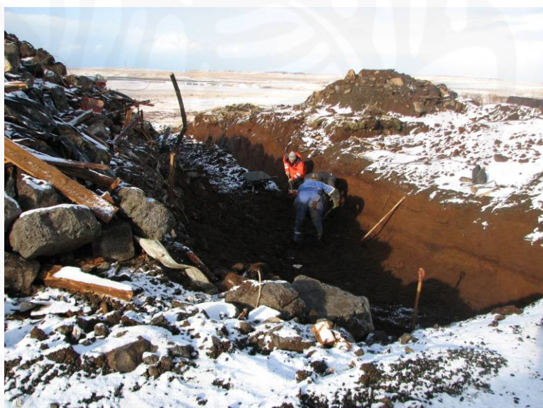
Mynd 2: Unnið að hreinsun á SK12 að loknum vélgræftri. Horft til vestnorðvesturs.

Eins og fram hefur komið var markmiðið upphaflega að hreinsa alveg upp grunn fjóssins og skrásetja allar minjar sem sæjust í botni hans, sem og sniðum. Vegna erfiðra aðstæðna reyndist ekki unnt að fjarlægja leifar fjóssins úr grunninum og því var brugðið á það ráð að grafa skurð