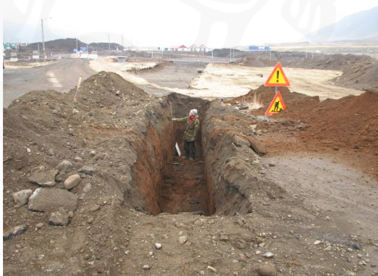
Mynd:4 Uggi Ævarsson að störfum í SK13. Horft til austurs

Upphaflega var það ætlun framkvæmdaaðila að leggja mikilvægar lagnir í vegstæðið sem liggja á um bæjarhólinn frá norðri til suðurs. Þegar í ljós kom að rannsóknir á þeim minjum sem sáust í SK-12 kynnu að hafa í för með sér