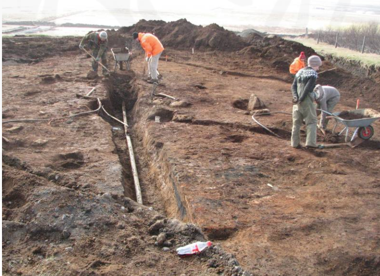
Mynd 6: Horft vestur eftir lagnaskurði sem liggur þvert í gegnum Svæði C