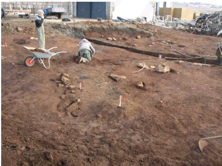
Mynd 7: Horft í austuðaustur yfir norðvesturhluta uppgraftarsvæðisins. Grjóthlaðinn veggur er rétt vinstra megin við miðja mynd.

Þegar yfirborðslög höfðu verið fjarlægð af uppgraftarsvæðinu var komið niður á talsvert mikil og blönduð lög af litríku torfi blönduðu með blettum af viðar og móösku hér og þar. Mannvirki voru ekki greinileg í fyrstu, en eftir að svæðið hafði verið hreinsað upp fóru að koma í ljós mögulegar hleðslur úr torfi og grjóti vestan til á svæðinu. Auk þess kom í ljós mjög skýr grjóthlaðinn veggur norðvestan til á svæðinu sem í fljótu bragði virðist mögulega tengjast þeim mannvirkjum sem sáust í SK3. 3 Vatnslögn liggur gegnum mitt