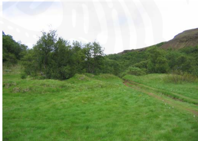
RA-615:005. Tóftir í Húsadal. Horft til Suðausturs - Mynd 1.2

sagði þá teljast allar þær mannvistarleifar sem eru innan deiliskipulagsreitanna í hættu þar til skýrari mynd er fengin af staðsetningu þeirra mannvirkja sem mögulega verða byggð þar í framtíðinni. Þó verður að teljast ólíklegt að rústunum í Húsadal verði raskað þar sem þær hafa verið þekktar um langa hríð og eru talsvert áberandi. Þótt ekki hafi fleiri fornleifar fundist í Húsadal er ekki loku fyrir það skotið að fleiri minjar geti leynst þar þótt ekki séu þær sjáanlegar á yfirborði, einkum á flatlendi. Litlar líkur eru aftur