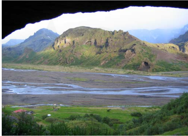
Útsýn úr Múlabóli til suðausturs - Mynd 1.3

í utarlega í vestanverðum Langadal, svonefnt Múlaból ( RA-615:013 ), sem er hellisskúti hátt uppi í suðausturhlíð Valahnúks. Eins er um bólið og rústirnar í Húsadal að þær teljast í hættu þar sem þær eru innan deiliskipulagsreitsins í Langadal. Þó verður að teljast ólíklegt að hættan sé raunveruleg þar sem bólið er staðsett hátt í brattri