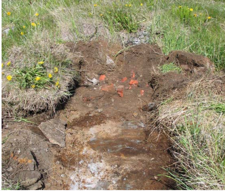
Mynd 4. Norðvesturhluti skurðar D. Múrsteinsbrot og steipt gólf.