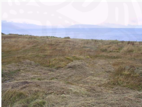
Mynd 1. Horft til suðausturs yfir Búðatanga.

Akureyrarbær hefur skipulagt byggð á Búðatanga í Hrísey á Eyjafirði. Eftir að skipulag hafði verið samþykkt kom í ljós að ekki hafði verið tekið tillit til mögulegra fornleifa á svæðinu og gerði Sigurður Bergsteinsson, minjavörður Norðurlands eystra, athugasemdir við fyrirætlaðar framkvæmdir. Taldi Sigurður að mögulega væru leifar fornra mannvirkja á hinu skipulagða svæði á tanganum og þyrfti að ganga úr skugga um hvort svo væri og þá hvers eðlis þær væru og hversu gamlar.