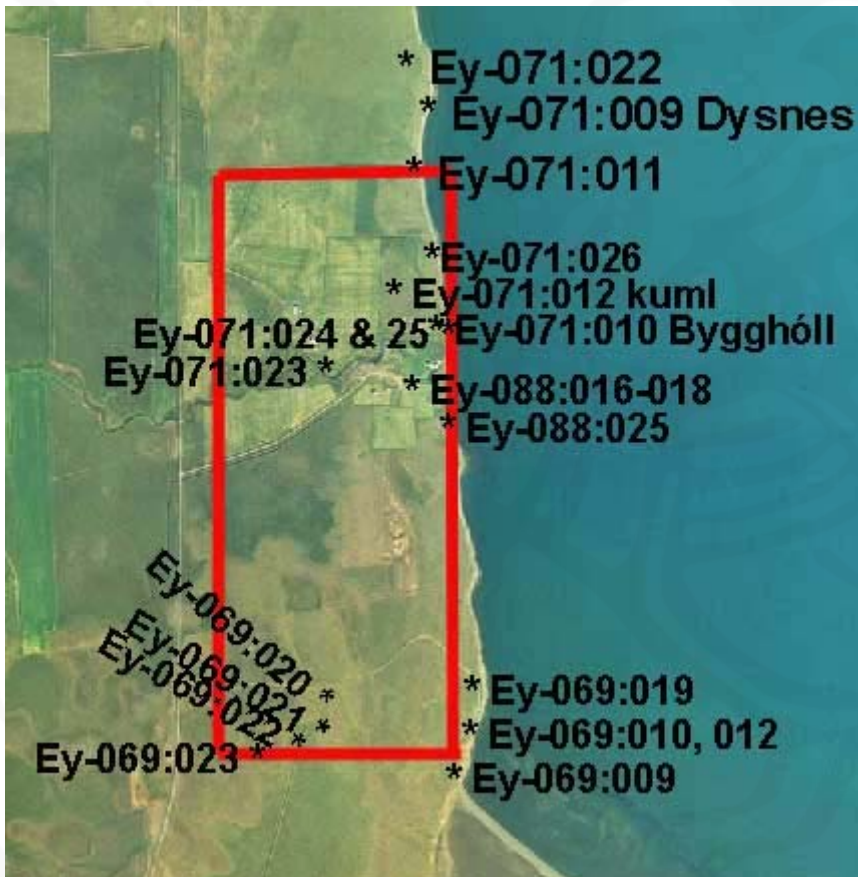
Mynd 2. Fornleifar hjá Dysnesi í Arnarneshreppi

Fyrirhuguð iðnaðarlóð í Eyjafirði nær u.þ.b. til fjögurra jarða, m.v. skiptingu þeirra samkvæmt Jarðatali Johnsens frá 1847, þ.e.a.s. Syðri-Bakki, Ós, Pálmholt og Hvammur. Búland, Litli-Bakki, Sjávarbakki, Gilsbakki, Sjávarbakki og fleiri býli hafa síðar byggst út úr þessum jörðum. Verður nú greint frá þeim minjum sem kunnugt er um á svæðinu, réttisælis frá norðurbrún lóðarinnar.