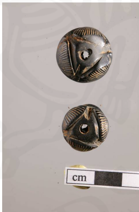
Mynd 8. Sörvisölur efri <147>, neðri <091>