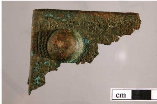
Mynd 9. Horn af bókarspjaldi <121>

(24 númer skráð), leir (21 númer skráð) og viður (15 númer skráð). Nokkuð magn fannst af nýlegu rúðugleri, leirtausbrotum og nöglum í uppfyllingunni [2039].