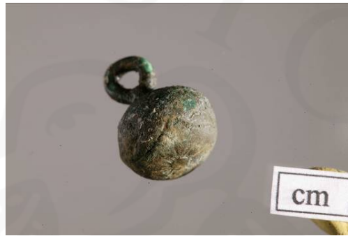
Mynd 12. Hnappur <127>

Fleiri bókarspensl fundust við uppgröftinn: <071> fannst í fyllingarlagi [2098], sem er e.t.v. í gröf. Það er grannt, með fíngerðu skrauti, fest við ferhyrnda leðurbót (sjá mynd 11). Svipuð spensl fundust við uppgröft í Skálholti, t.d. S184 sem talið er vera frá 17. eða 18. öld 16 . <144> og <168> fundust í torflagi [2111]. <144> er stutt og grönn þynna með geometrísku skrauti ristun ofaná, sem er fest á ferhyrnda leðurbót sem á er negld koparþynna til styrktar (sjá mynd 11). <168> er frábrugðið hinum, mun fíngerðara, með 2 götum og 2 lykkjum. Það líkist gripum sem til eru í Þjóðminjasafni Íslands, t.d. Þjms. 8917 og 8933.