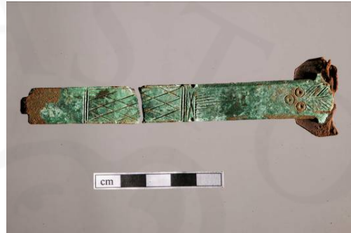
Mynd 10. Bókarspensl <149>

Mikið af rúðuglerinu var nýlegt að sjá, en þar voru einnig nokkur brot sem hafa grænleita slikju og bólur, <030> fannst í torfi [2068] sem haldi kirkjutóft, <093> í fyllingu [2105] milli steina í innri hleðsluröð [2097] í austurgafli kirkjunnar, og <179>, <181> og <183> í slitróttu torflagi [2111] neðarlega í gólfi kirkjunnar. Nokkuð fannst af gleri úr flöskum; <123> sem er stútur með útflattri, láréttri brún, af meðalaglassi úr grænleitu gleri með bólum, fannst í torflagi [2111]; <022> og <106> sem hafa áletrun á botni fundust í uppfyllingarlægum [2039] og [2058]; <098> sem fannst í fyllingarlagi [2112] og <145> í fyllingarlagi grafar [2099] hafa ferhyrndan botn. Hugsanlega má aldursgreina þessar flöskur stílfraðilega og af áletrunum. Í sama fyllingarlagi fannst einnig lítil, glær sörvistala <140> úr gleri (sjá mynd 7).