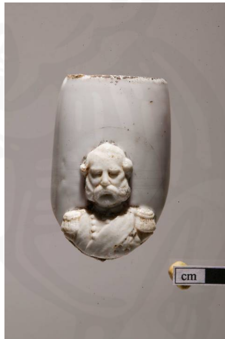
Mynd 14. Reykjarpípa <033>

Leirkerabrot þau sem fundust voru öll af nýlegum gerðum. Nokkur brýnisbrot fundust, m.a. þrjú úr flögubergi, <113>, <129> og <165>. Meðal viðargripa voru nokkrir sem greinilega voru tilsneiddir, helst stautar og pinnar einhvers konar. Þeir, ásamt fjölda járnagla sem fundust hafa vafalaust tilheyrt kistum hinna látnu í kirkjugarðinum.