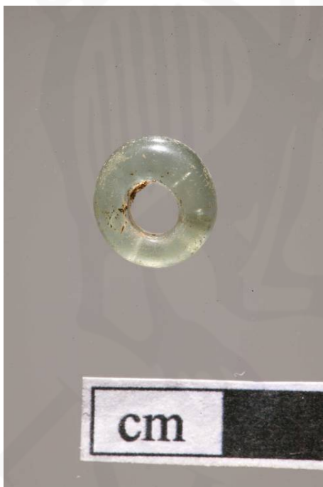
Mynd 7. Sörvistala <140>

Skráð fundanúmer voru alls 203 (sjá fundaskrá), en undir sumum þeirra er að finna fleiri en einn grip. Helstu efnisflokkar eru gler (51 númer skráð), járn (55 númer skráð), kopar