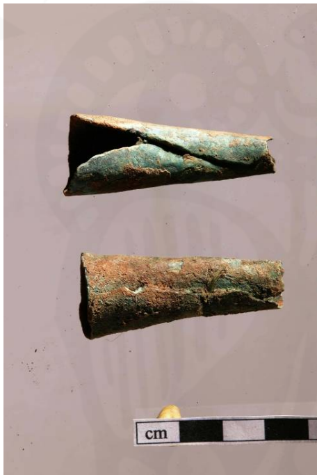
Mynd 13. Kertarpípur efri <048>, neðri <136>

Í torflagi [2068] fundust brot úr reykjarpípu úr postulíni, <033> og <039>. Þetta hefur verið stór pípa og framan á henni er upphleypt mynd af Kristjáni 9. (sjá mynd 14.), en hann var Danakonungur frá 1863 þar til hann andaðist árið 1906. Svona pípur voru framleiddar við sérstök tækifæri. Einnig fundust nokkur brot úr krítarpípum í uppgreftinum, bæði leggir og brot úr kóngum. Krítarpípur voru fyrst notaðar á Íslandi á 17. öld.