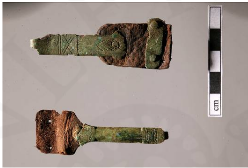
Mynd 11. Bókarspensl efra <144>, neðra <071>

119 mm langt, hefur rist, geometrískt skraut ofaná, lykkju í annan endann og er fest á leðurbót. Það líkist bókarspensli sem fannst við uppgröftinn 2002 (RKH-2002-25-135). Sams konar horn og spensl eru á Guðbrandsbiblíu sem til er í Þjóðminjasafni (Þjms. 1902) en hún var prentuð árið 1584.