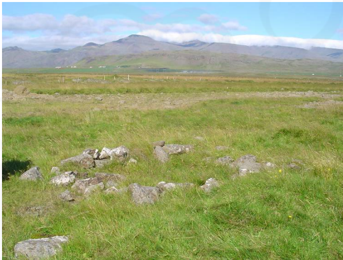
Mynd 3: Tóft (024) á Efra-Móholti, horft í norður.

hafa nú verið ræstar fram að mestu leyti með skurðum en hross eru höfð í girðingu á holtunum. Gengið var um allt svæðið og það kannað með tilliti til fornleifa. Fyrirfram var aðeins vitað um einn fornleifastað á svæðinu: mógrafir við Efra- og Neðra- Móholt. Enn sjást greinileg merki grafanna (22) austan við holtin, rúma 300 m norðaustur af bæ. Þá fannst grjóthlaðin tóft (24) á Efra-Móholti, vestan við mógrafirnar. Ekki er vitað hvaða hlutverki hún gegndi og örðugt að ráða það af lögun hennar. Helst má þó giska á að þar hafi verið lítið aðhald eða kvíar. Hleðslur virðast aldrei hafa verið háar og því líkast því sem ekki hafi verið lokið við mannvirkið. Ekki er að sjá að uppsöfnuð byggingarefni séu undir tóftinni og því líklega aðeins um eitt byggingarstig að ræða.