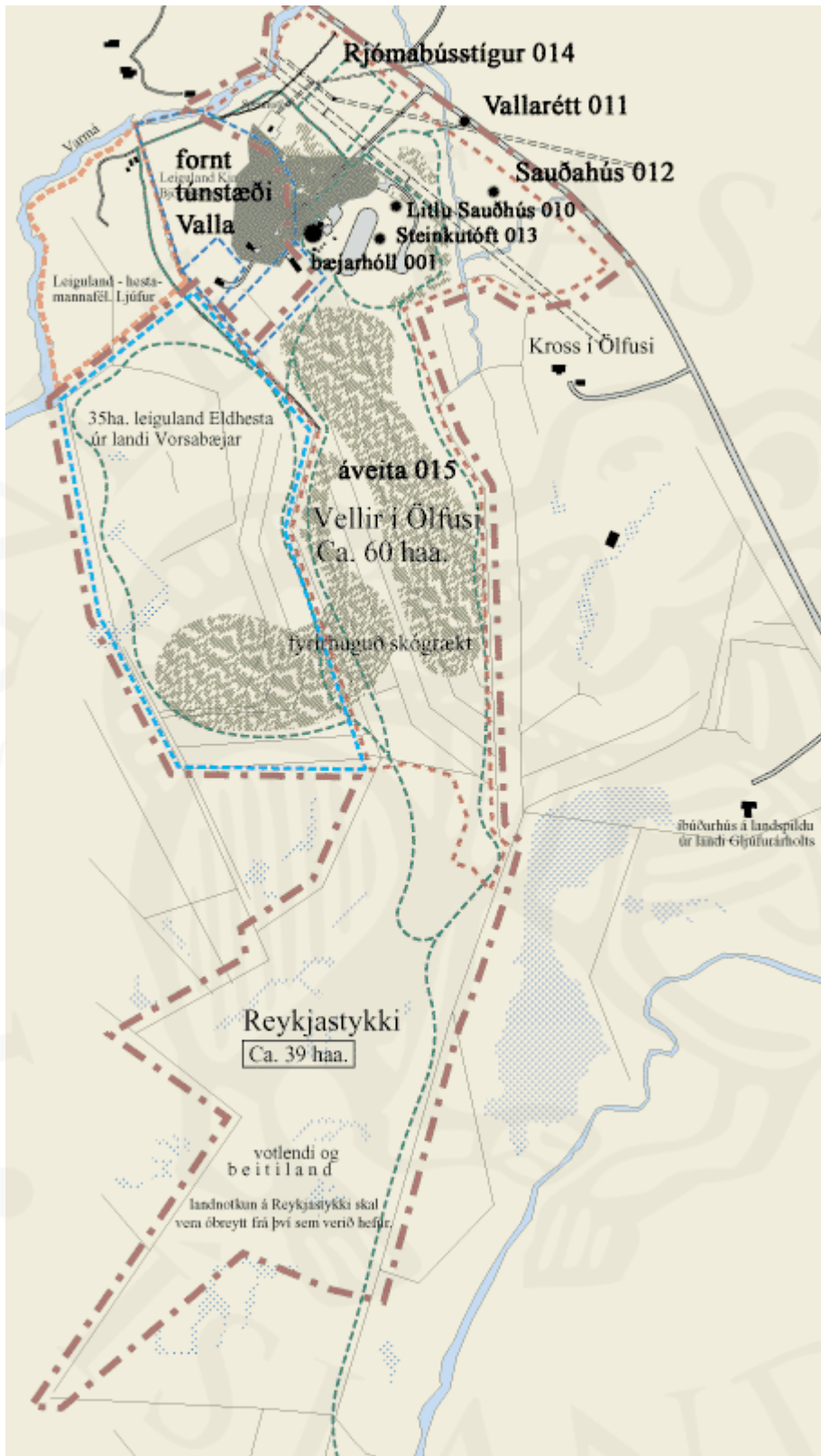
Kort 2. Þekktir minjastaðir í landi Valla í Ölfusi, merktir inn á kort frá Landform.