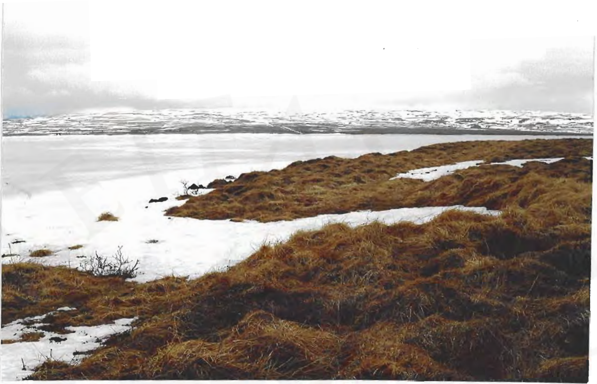
Dráttur. Lending á Austureyjarnesi