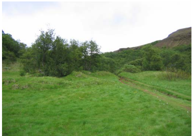
RA-615:005. Tóftir í Húsadal. Horft til Suðausturs - Mynd 1.2

sagði þá teljast allar þær mannvistarleifar sem eru innan deiliskipulagsreitanna í hættu þar til skýrari mynd er fengin af staðsetningu þeirra mannvirkja sem mögulega verða byggð þar í framtíðinni. Þó verður að teljast ólíklegt að rústunum í Húsadal verði raskað þar sem þær hafa verið þekktar um langa hríð og eru talsvert áberandi. Þótt ekki hafi fleiri fornleifar fundist í Húsadal er ekki loku fyrir það skotið að fleiri minjar geti leynst þar þótt ekki séu þær sjáanlegar á yfirborði, einkum á flatlendi. Litlar líkur eru aftur á móti taldar á að fornleifar sé að finna í hinum skógivöxnu hlíðum dalsins.