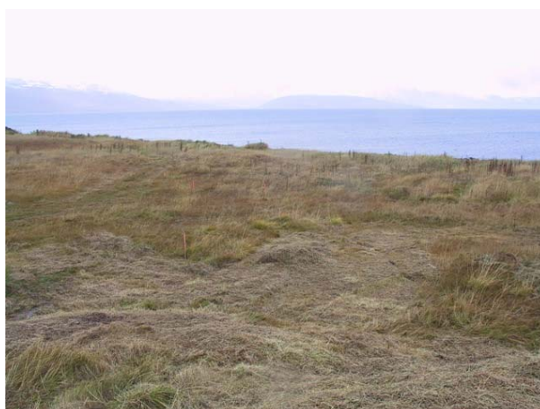
Mynd 1. Horft til suðausturs yfir Búðatanga.

Akureyrarbær hefur skipulagt byggð á Búðatanga í Hrísey á Eyjafirði. Eftir að skipulag hafði verið samþykkt kom í ljós að ekki hafði verið tekið tillit til mögulegra fornleifa á svæðinu og gerði Sigurður Bergsteinsson, minjavörður Norðurlands eystra, athugasemdir við fyrirætlaðar framkvæmdir. Taldi Sigurður að mögulega væru leifar fornra mannvirkja á hinu skipulagða svæði á tanganum og þyrfti að ganga úr skugga um hvort svo væri og þá hvers eðlis þær væru og hversu gamlar.