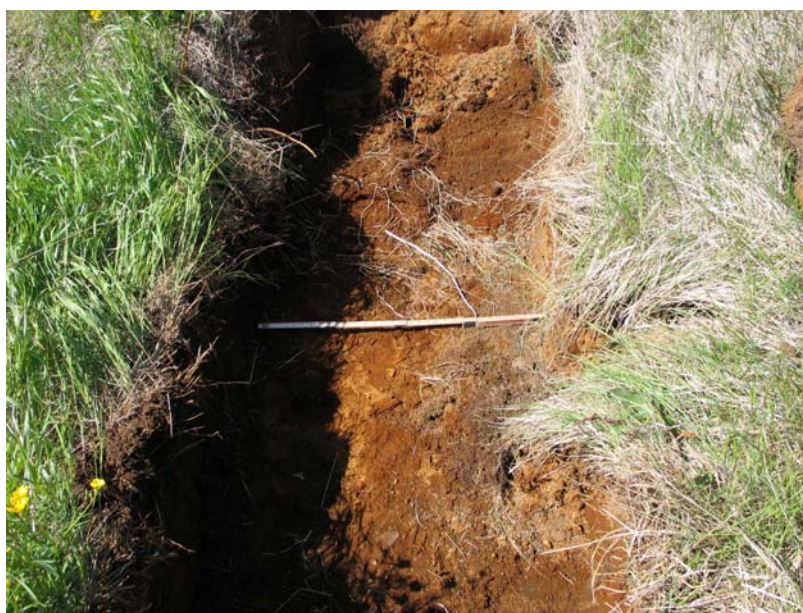
Mynd 3. Norðurhluti skurðar B.

Snýr í sa. N-S. Lengd 3 m. Breidd 0,9 m. Dýpt 0,80 m. Snið sýndi: Grusrót sa. 0,2 m. Sjávarhnúllungar í moldarlagi sa. 0,2 m. Óhreyfð rauðbrún mold með ljósum gjóskulinsum og einstaka dökkum rákum, sa. 0,4 m. Engar mannvistarleifar.