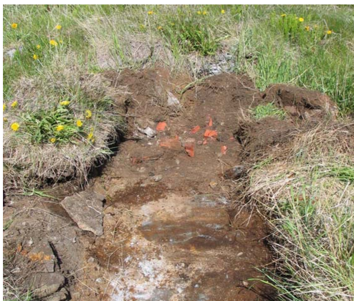
Mynd 4. Norðvesturhluti skurðar D. Múrsteinsbrot og steipt gólf.