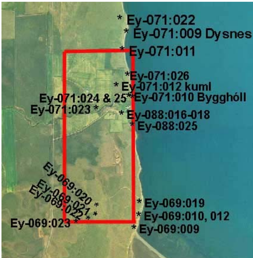
Mynd 2. Fornleifar hjá Dysnesi í Arnarneshreppi

Fyrirhuguð iðnaðarlóð í Eyjafirði nær u.þ.b. til fjögurra jarða, m.v. skiptingu þeirra samkvæmt Jarðatali Johnsens frá 1847, þ.e.a.s. Syðri-Bakki, Ós, Pálmholt og Hvammur. Búland, Litli-Bakki, Sjávarbakki, Gilsbakki, Sjávarbakki og fleiri býli hafa síðar byggst út úr þessum jörðum. Verður nú greint frá þeim minjum sem kunnugt er um á svæðinu, réttisælis frá norðurbrún lóðarinnar.