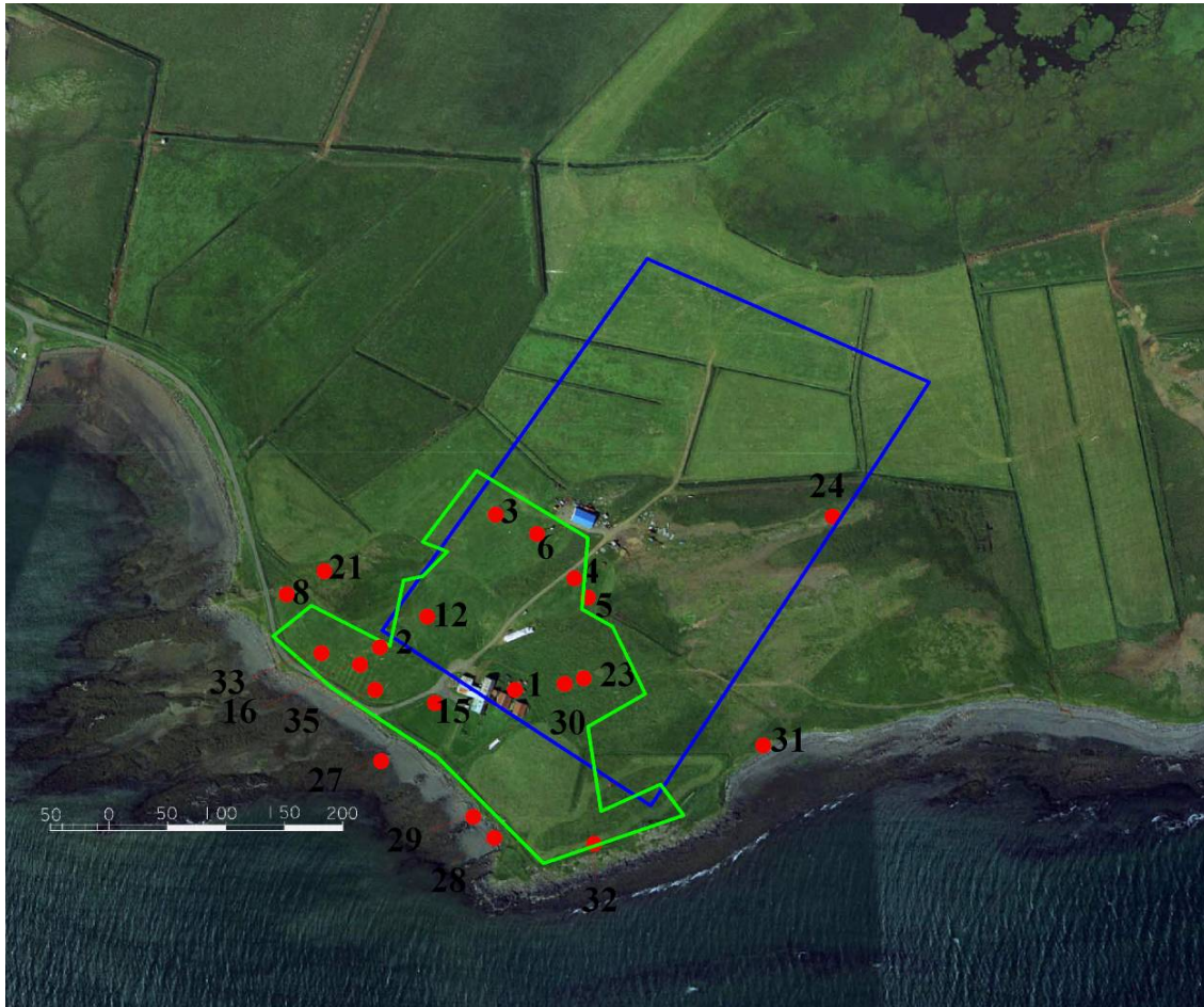
Mynd 1. Byggingareitur A. Fornleifar á Katanesi. Númerin vísa til fornleifaskrár Kataness. Ljósgræna línan sýnir mörk gamla túnsins um 1920. Ljósbláa línan sýnir fyrirhugaða staðsetningu verksmiðjunnar.

hann hafi ávallt staðið á sama stað. Á bæjarhólnum stendur steinsteypt íbúðarhús og gömul útihús. Ekki leikur vafi á að í bæjarhólnum eru miklar mannvistarleifar.