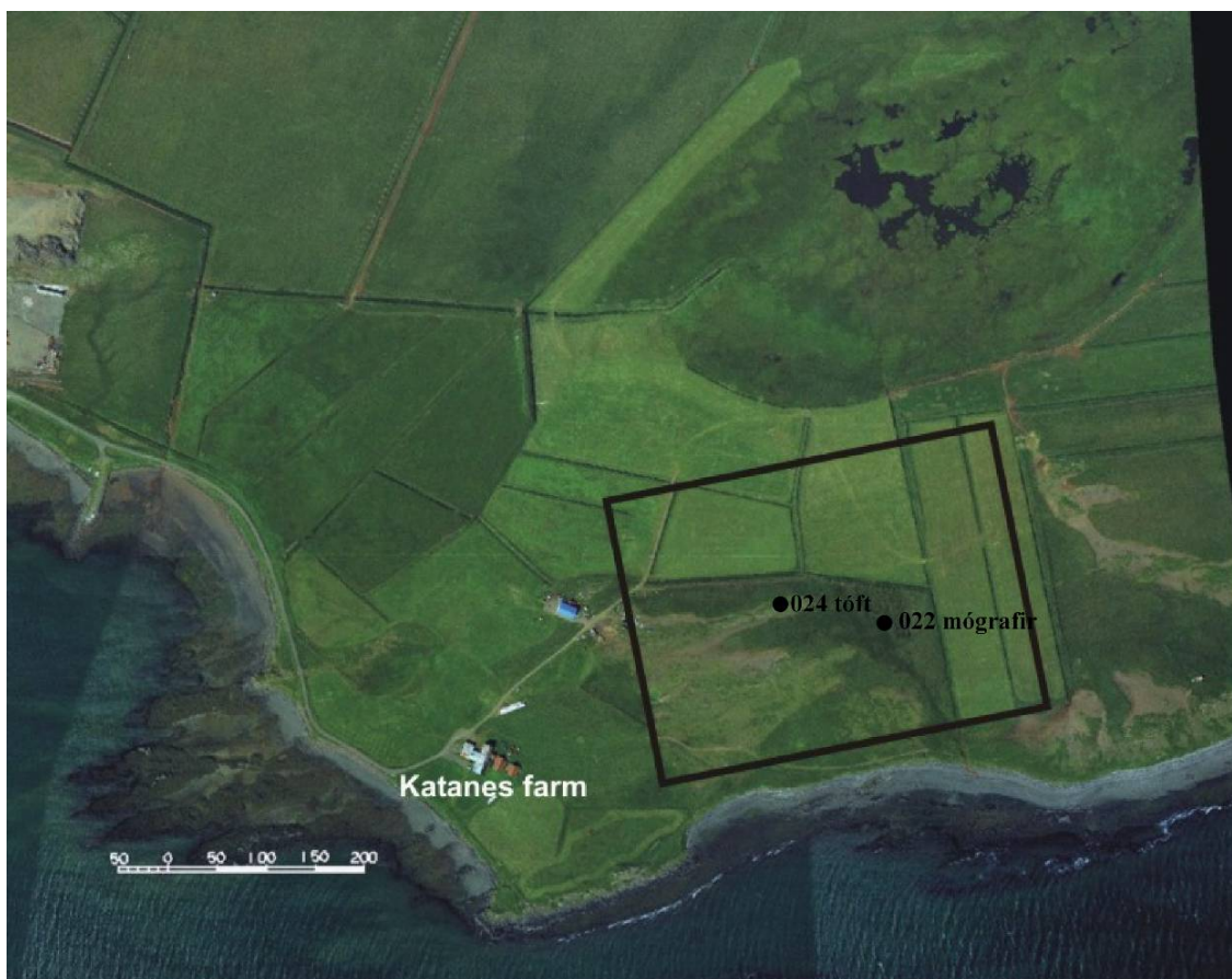
Mynd 2. Byggingareitur B. Númerin vísa til fornleifaskrár Katanes. Svarta línan afmarkar fyrirhugað framkvæmdasvæði.

Um mitt sumar 2003 var Fornleifastofnun Íslands tilkynnt að ákveðið hefði verið að kanna aðra möguleika á staðsetningu rafskautaverksmiðju í Katanesi. Nýjar hugmyndir gerðu ráð fyrir að verksmiðjan yrði reist austan Katanesstúns, Nær svæðið næstum að sjávarbakkanum