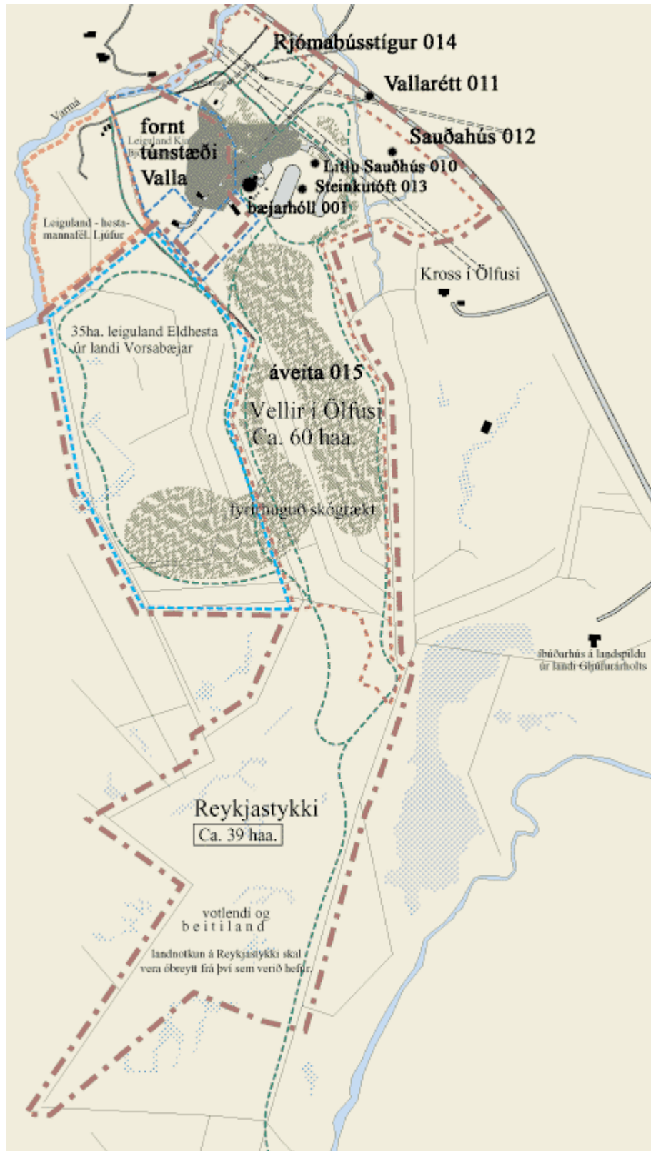
Kort 2. Þekktir minjastaðir í landi Valla í Ölfusi, merktir inn á kort frá Landform.