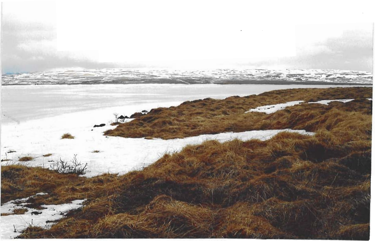
Dráttur. Lending á Austureyjarnesi